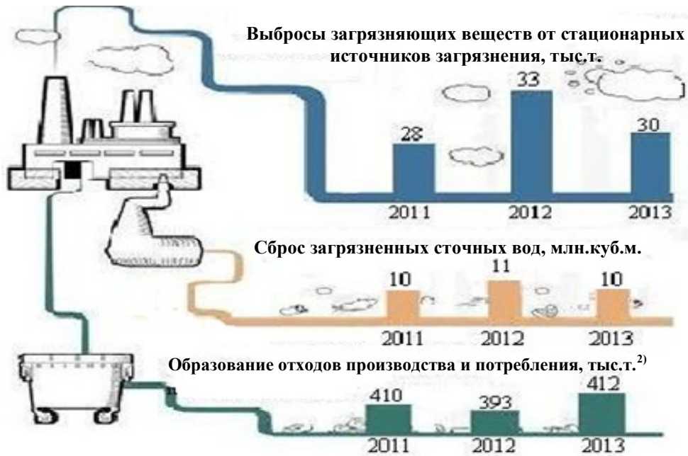
Выбросы наиболее распространенных загрязняющих атмосферу веществ, отходящих от стационарных источников (на душу населения, кг.)